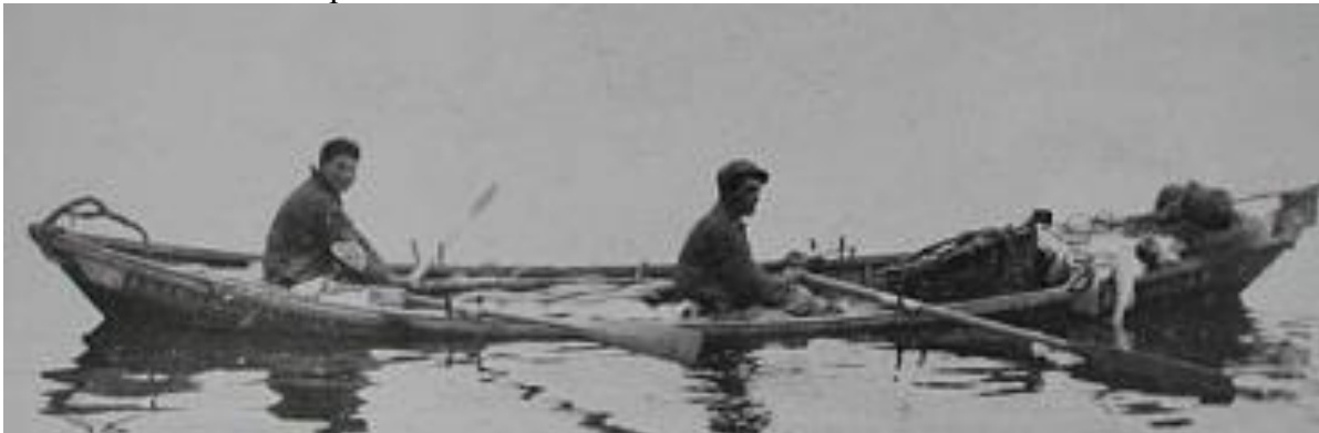
Doris des bancs lourdement chargé de morue

Vers 1900, associé aux régates à la voile les courses de canots se font à l'aviron et non à la godille, c'est seulement plus tard que l'on verra apparaître des courses à la godille .