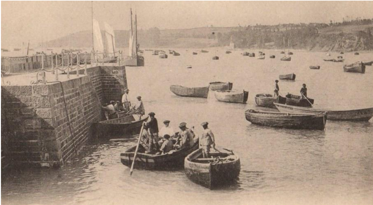
Cancale, les solides canots des bisquines de Cancale sont propulsés à la godille dans le port ou à l'aviron en action de pêche aux cordes