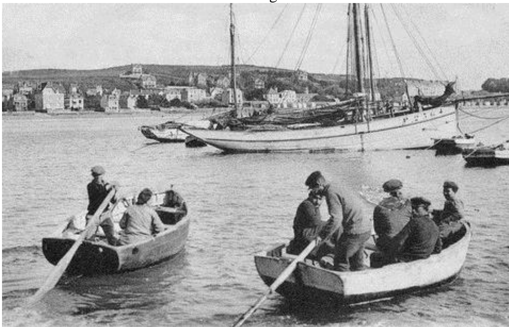
Les canots des langoustiers de Loguivy ramenant les équipages à bord

Mars 2015