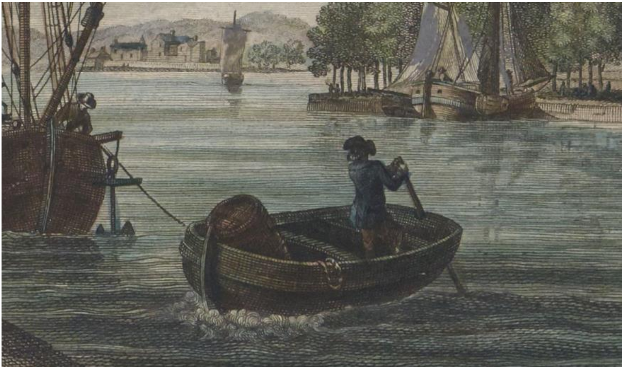
Canot à la godille dans le port de Landerneaux gravure de Pierre Ozanne vers 1780

Pour la propulsion à l'aviron le terme marin est nager, le verbe ramer n'est pas marin du moins au XIX ème siècle.