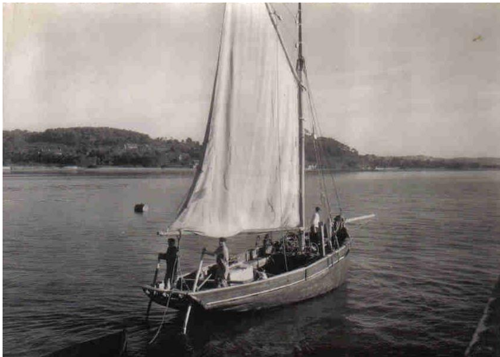
Gabare du Trieux quittant Paimpol, deux godilleurs propulsent le bateau

Mars 2015