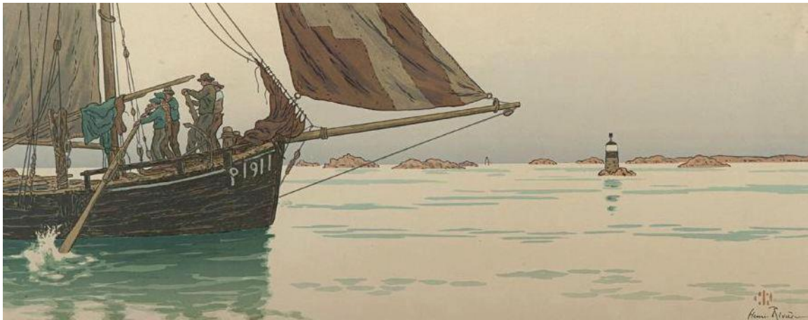
Gabare du Trieux plus ancienne que la précédente descendant l'estuaire par temps calme, hommes et un mousse tirent sur deux grand avirons à l'avant du bateau peinture d'Henri Rivière