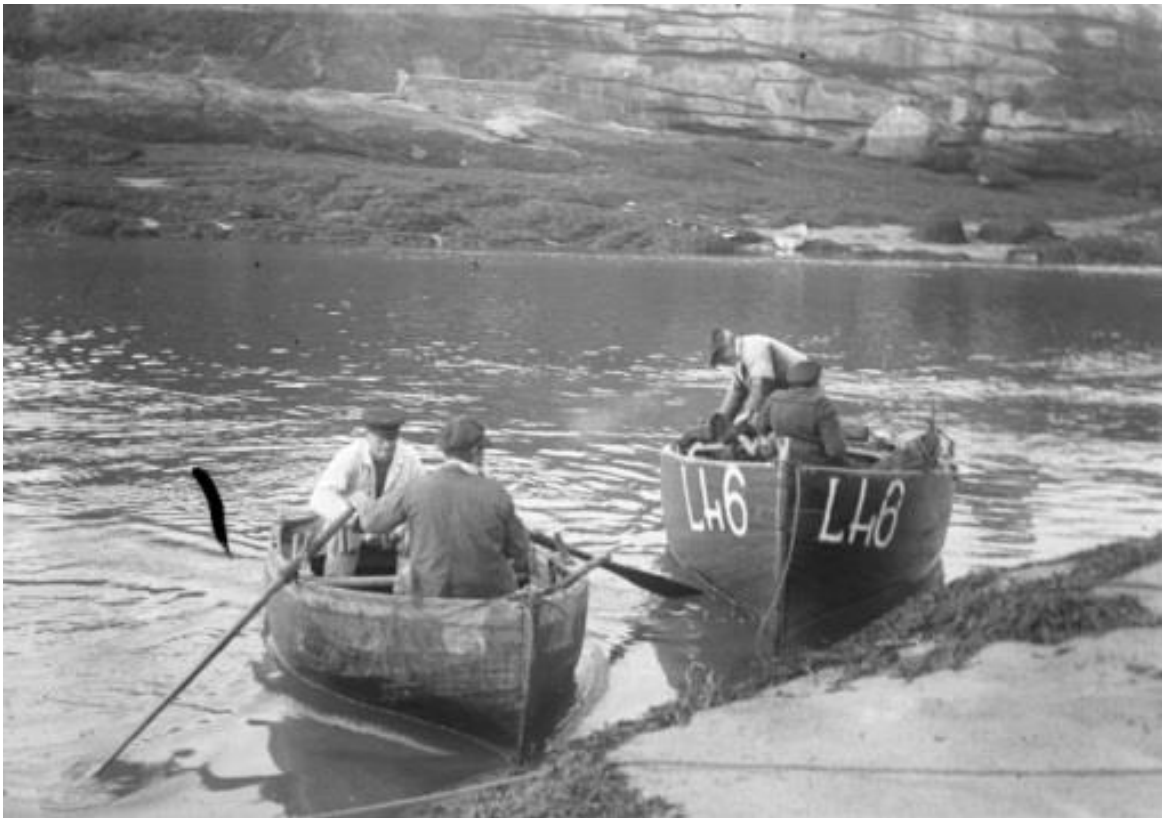
Petits canots de Ploumanac'h, les grands numéros datent de la guerre de 14, l'un des canots est à la godille l'autre à l'aviron