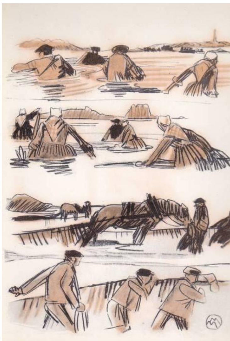
Travail des dromes à Roscoff par Mathurin Méheut