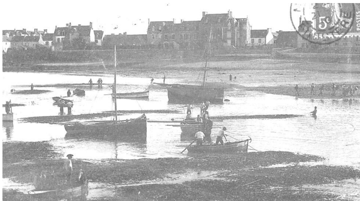
Arrivée des dromes dans le port de Roscoff, des canots les accompagnent

Le terme drome est issu du vocabulaire maritime, il a deux significations selon le dictionnaire abrégé de marine du capitaine de frégate Bonnefoux 1834 : Réunion des pièces de mature de rechange d'un bâtiment et Réunion de pièces de bois ou de barriques que l'on amarre ensemble, quand on veut les mettre ou les laisser à Flot