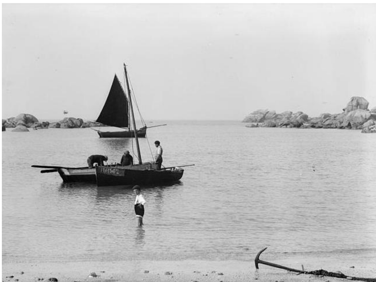
La grève de Pontusval dans les années 30 par beau temps le sloop noir ressemble peut être à la Marie