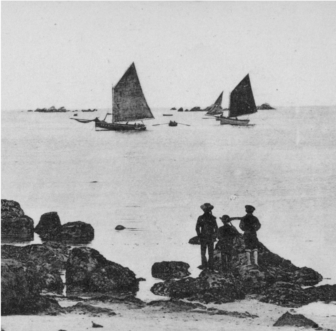
Le port de Brignogan, un jour de régates, La Marie est comme le sloop blanc

Deux frères, l'un patron du canot de sauvetage Georges Bréant et l'autre canotier meurent en laissant deux veuves dans le plus complet dénuement