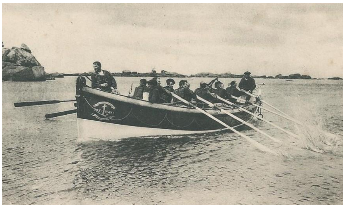
Le canot de sauvetage de Pontusval (Brignogan) la Léonie jusqu'en 1911 puis le Georges Bréant