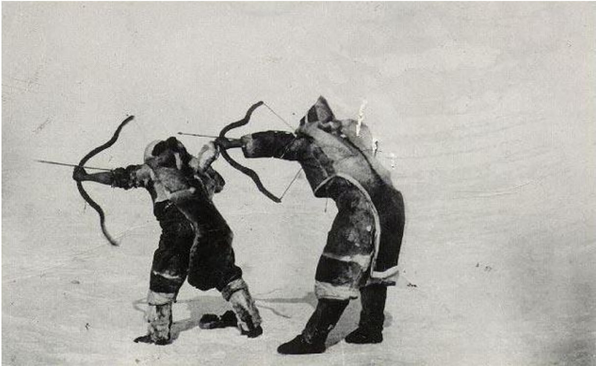
Les inuits pratiquaient la chasse à l'arc, la formes des arcs varient en fonction des régions

Ce récit du vice-amiral Thévenard est interprété dans sa biographie, comme quoi il aurait été à la tête d'une expédition de destruction de village inuits