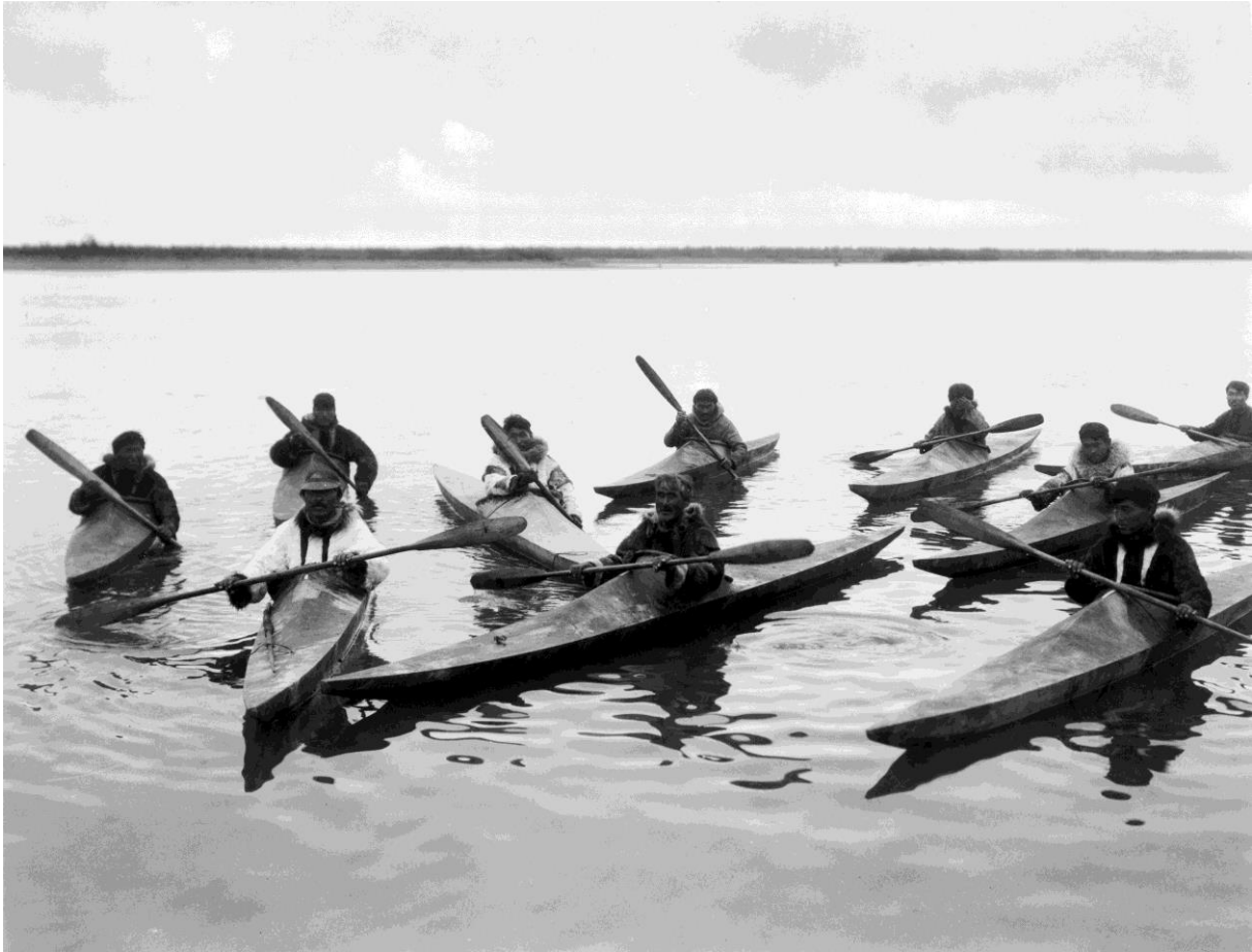
Flottille de kayaks inuits

En 1800 le vice-amiral Antoine Thevenard dans « mémoires relatifs à la marine » dans une note « sur les noms de différents lieux des côtes de Terre-Neuve et du Labrador » décrit des attaques de pêcheurs malouin par des sauvages en voici la description ( orthographe d'époque du livre a été respecté ).