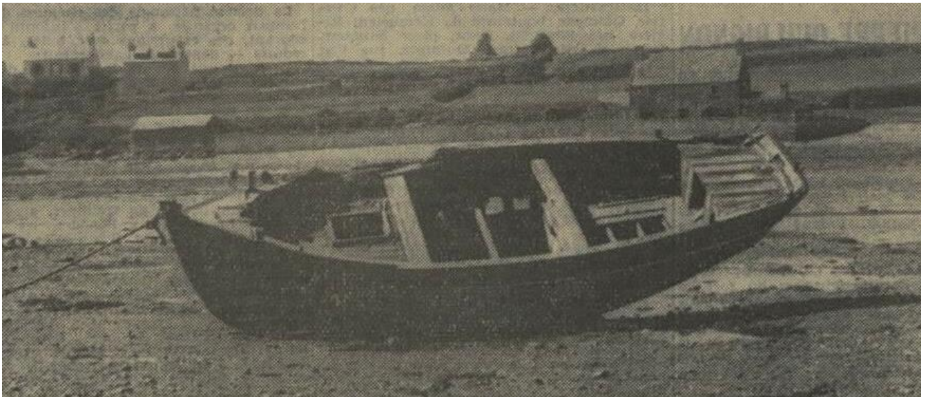
Le canot à misaine demi ponté Guy Ferryville (Photo la dépêche de Brest)