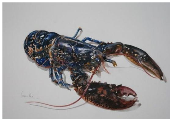
Etude de homard par Yann Lesacher

Dans la Dépêche de Brest du 13 juillet 1907