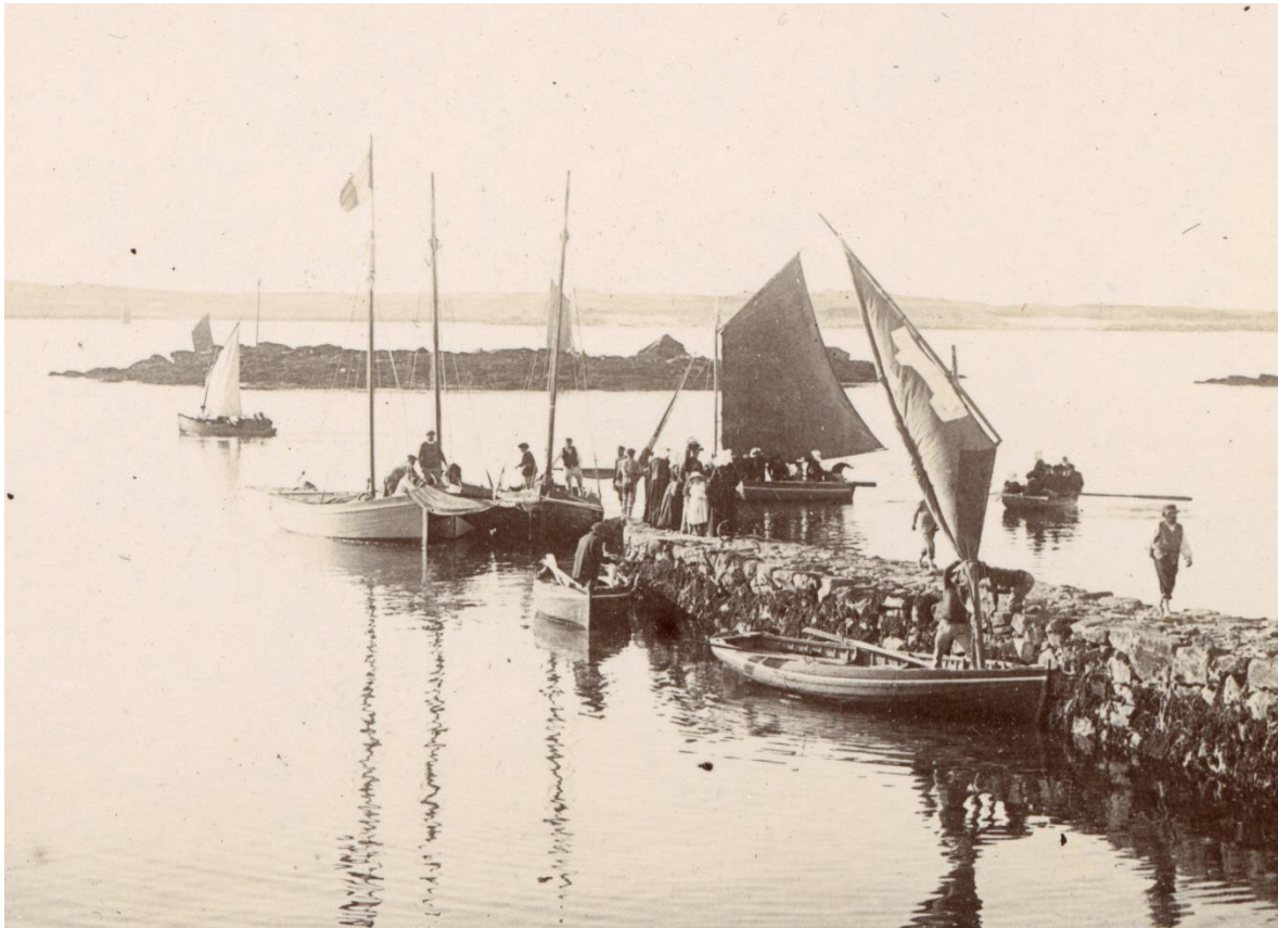
La cale du vil à Roscoff en été 1896, sloups et péniches de passage de l'île de Batz