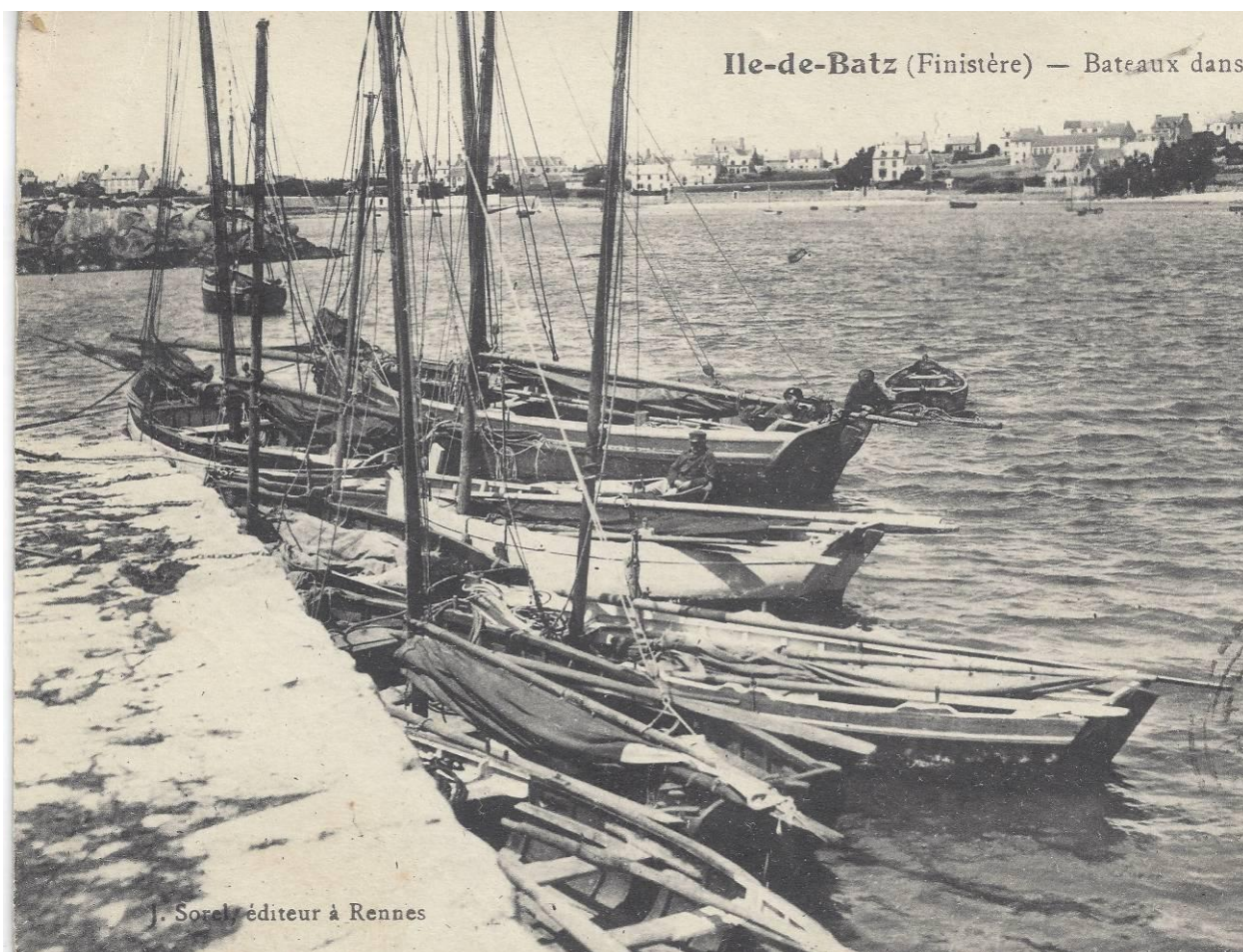
Péniches et sloups de passage à l'île au moutons après 1913

Pour découvrir les péniches de l'île : un article du site