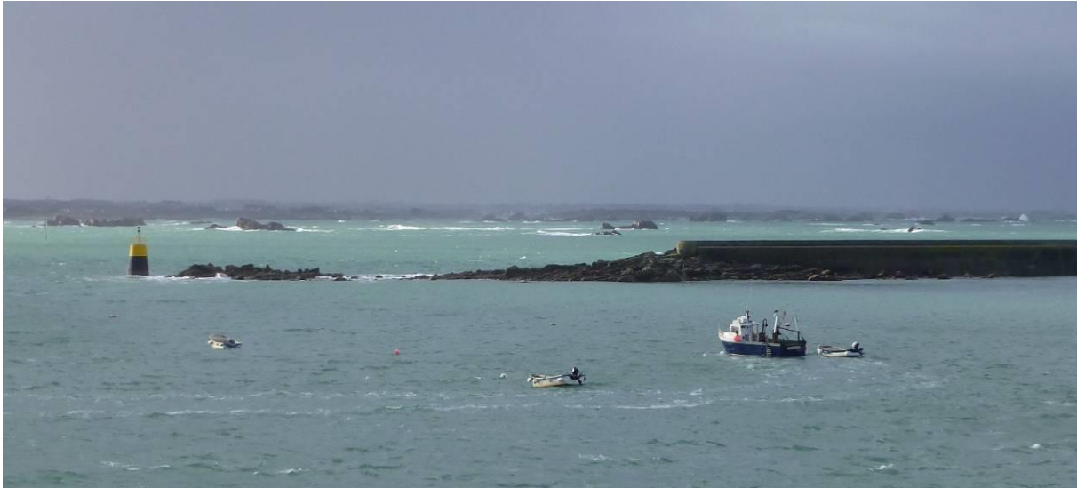
Malvoc'h et le mole de l'île de batz en février 2014

Malvoc'h est bien connu des iliens de l'île de Batz et de ceux qui fréquentent le chenal . Un plateau de cailloux au bout du mole avec à son extrémité Est la tourelle cardinale sud de Malvoc'h . Mais il y a deux siècles il existait l'île Malvoc'h ! Deux documents anciens, antérieurs à la construction du môle témoignent qu'à l'emplacement du musoir du mole il existait une île.