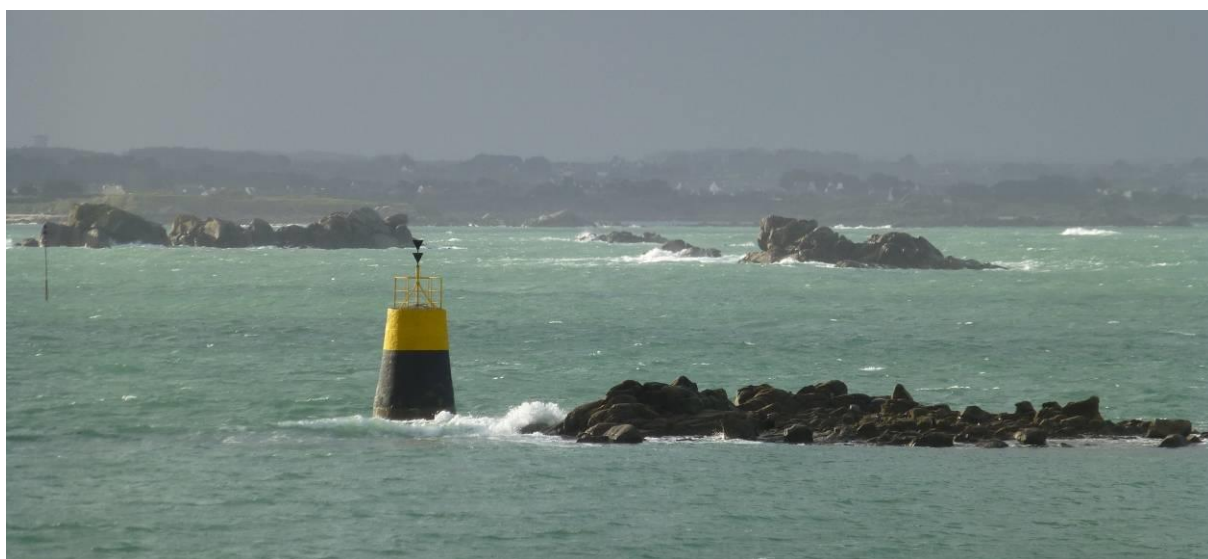
Malvoc'h hiver 2014

Bien plus tard, dans les années 1980, une autre île du port disparaîtra lors de la construction de la cale de la barge et du port de pêche : Ar Vil Vihan incluse dans le terre plein du port