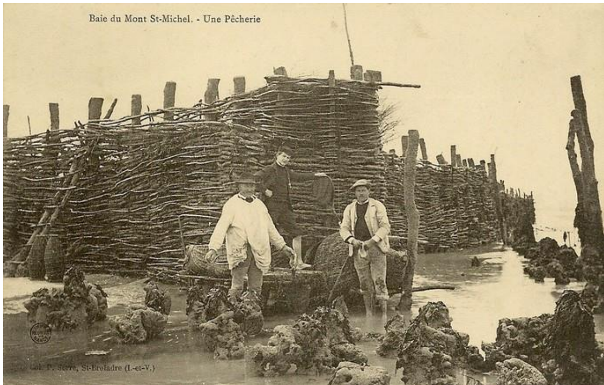
Pêcherie en fascines de bois en baie de Cancale vers 1900