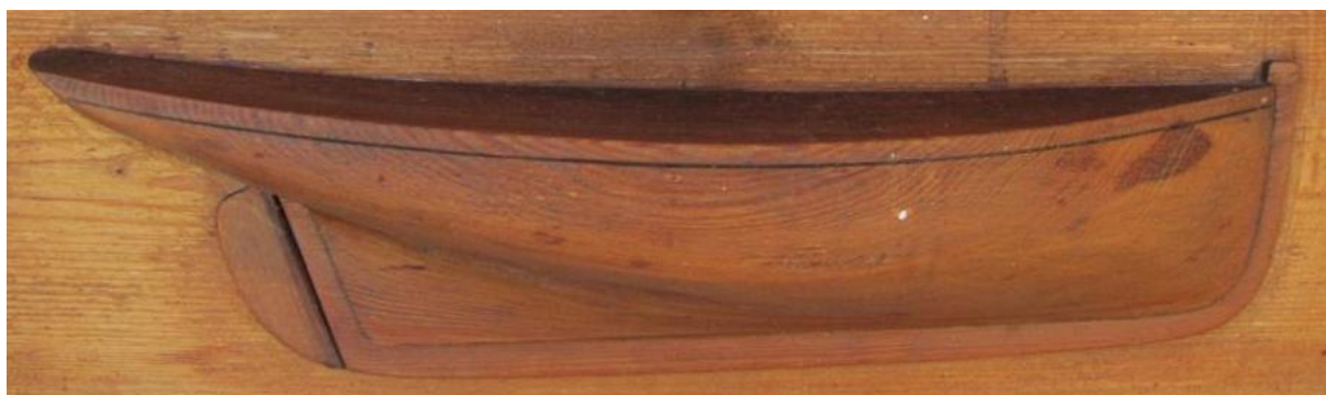
Demi-coque originale du Roscovite

Jacques de Thézac , jeune yachtman, mais avant tout passionné du monde de la mer, proche des marins, cet humaniste fut à la création de l'œuvre des abris du marin et de l'almanach du marin Breton . Plus tard le Roscovite fut la propriété du peintre Paul Signac un amoureux de la Bretagne et des bateaux