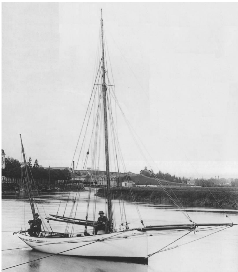
Le Roscovite au mouillage on apprécie ses formes et son gréement original