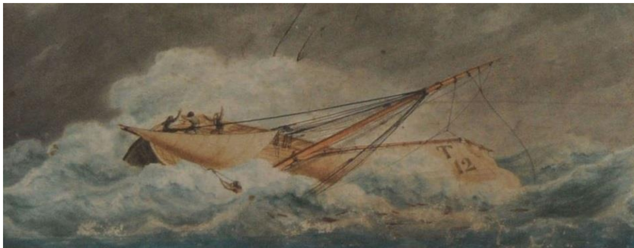
Nauffrage d'un sloup en Normandie (barque de Trouville T12, ex voto à Equermauville)