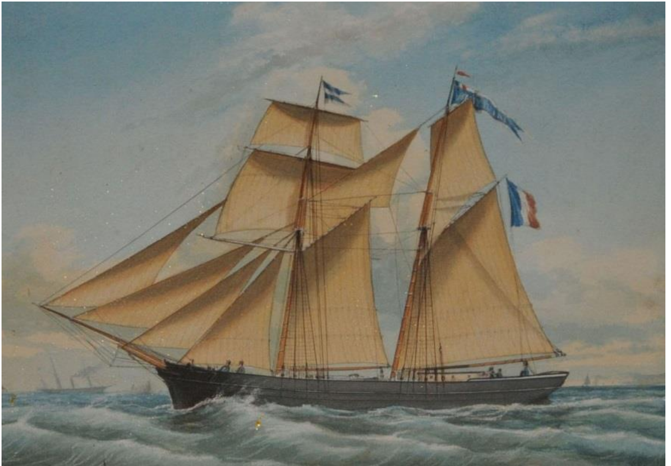
Goélette de cabotage Marie Pauline, les goélettes à hunier ancienne n'ont pas encore en 1879 le hunier à rouleau caractéristique des goélette d'Islande postérieures (ex voto à Equermauville)

Aout 2018 Pierre-Yves Decosse http://www.histoiremaritimebretagnenord.fr/