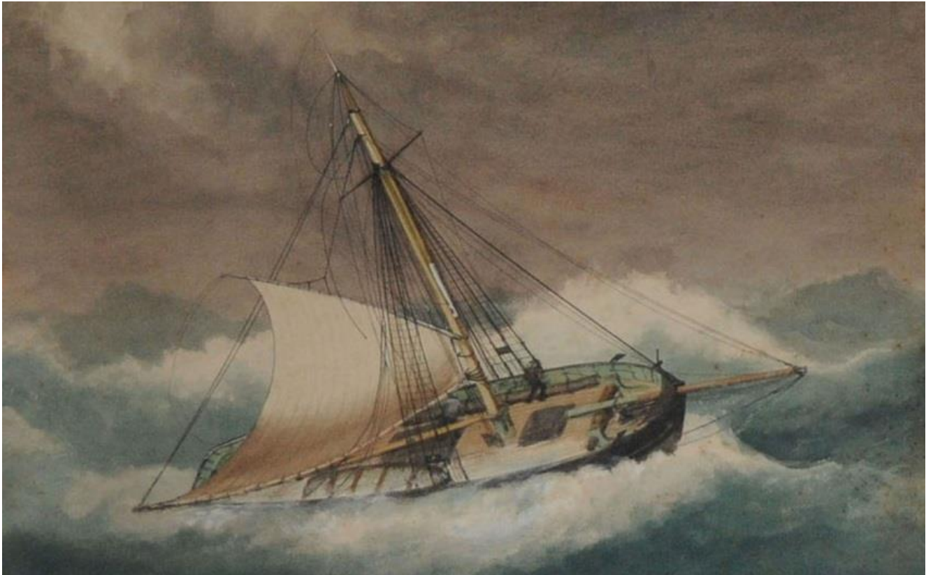
Cotre de cabotage par gros temps à la cape sous grand-voile arrisée écoute choquée (ex voto à Equermauville)

Voici un extrait du rapport du capitaine Allain publié dans le même journal :