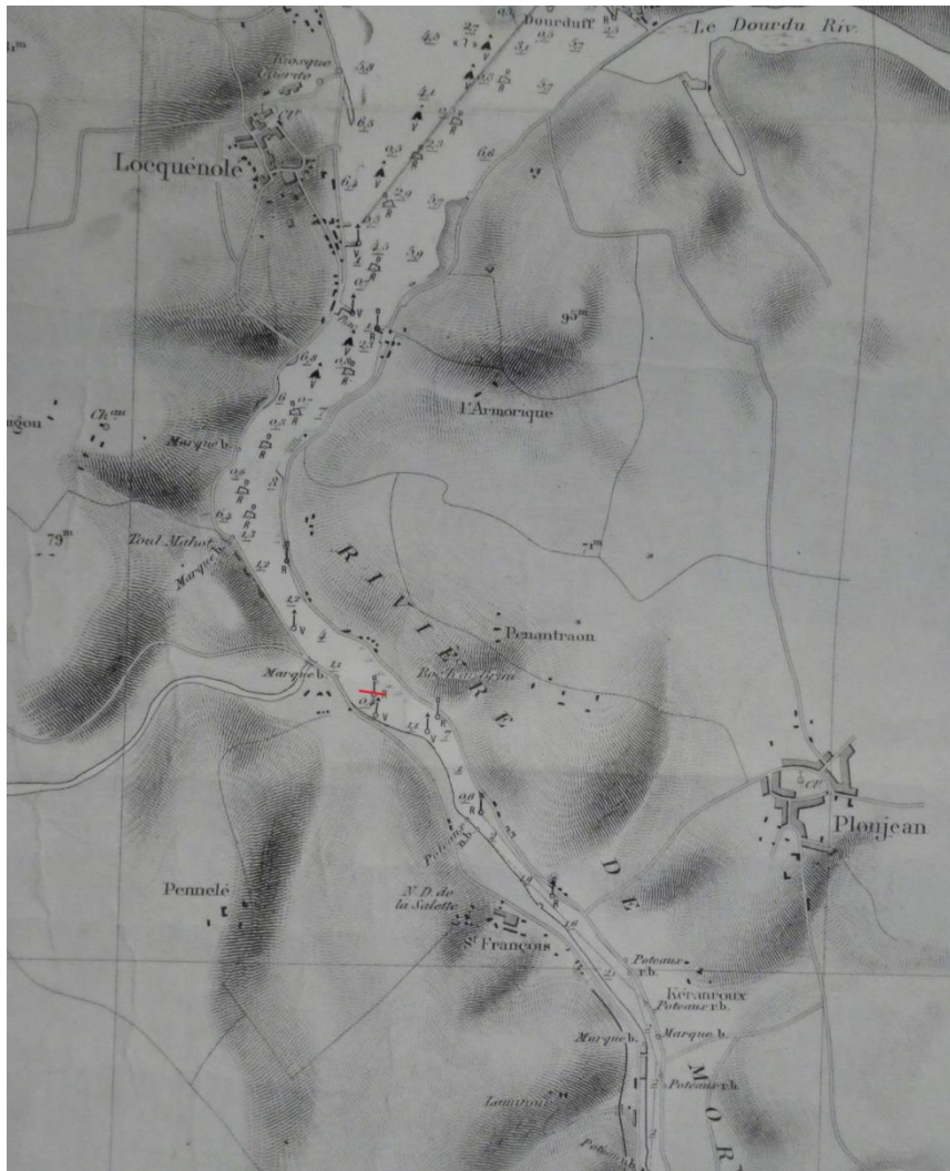
Extrait de l'ancienne carte du SHOM de la baie de Morlaix en rouge l'emplacement du Havrais échoué

Ces efforts combinés furent couronnés de succès. Grâce à cette manœuvre habilement conduite, le Havrais, un instant après, flottait librement dans la rivière de Morlaix. Il a regagné le bassin, pour opérer le chargement des marchandises débarquées. »