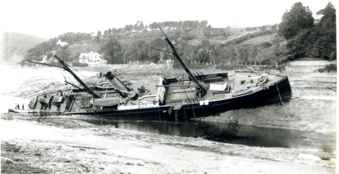
Le vapeur le Havrais échoué en rivière de Morlaix

Le photographe Muller, qui exerçait à Morlaix au début du XXème siècle, a saisi cette impressionnante scène, le nom de ce navire, la date et la localisation de cet échouement sont restées longtemps, pour moi, des questions non résolues. Une observation attentive de la photo m'a toutefois permis d'en identifier le lieu sur la rivière de Morlaix, ce vapeur est échoué juste en dessous du château de Lannuguy quelques centaines de mètres en amont du pont de la Pennelé et de l'embranchement de la montée vers Taulé.