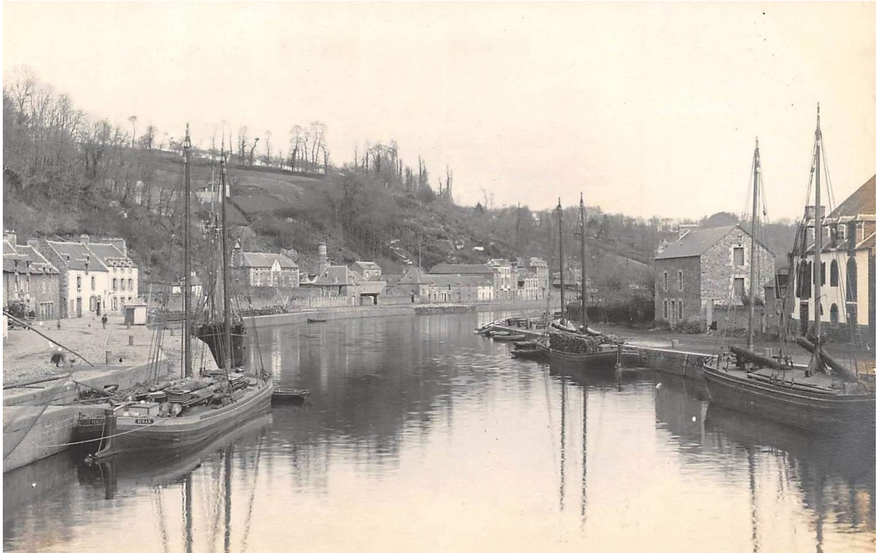
Superbe photos du port de Dinan vers 1890, trois chalands de Rance sont équipés de leurs mâts et de leur voilure sous étui, un est chargé de bois de chauffage pour Saint-Malo

Le samedi 13 mars [1880], M. Duval, patron de chaland à Dinan, ramenait de St-Malo vers notre ville son bateau la « Ville de Saint-Malo » chargé de fonte et de savon, à destination de Rennes.