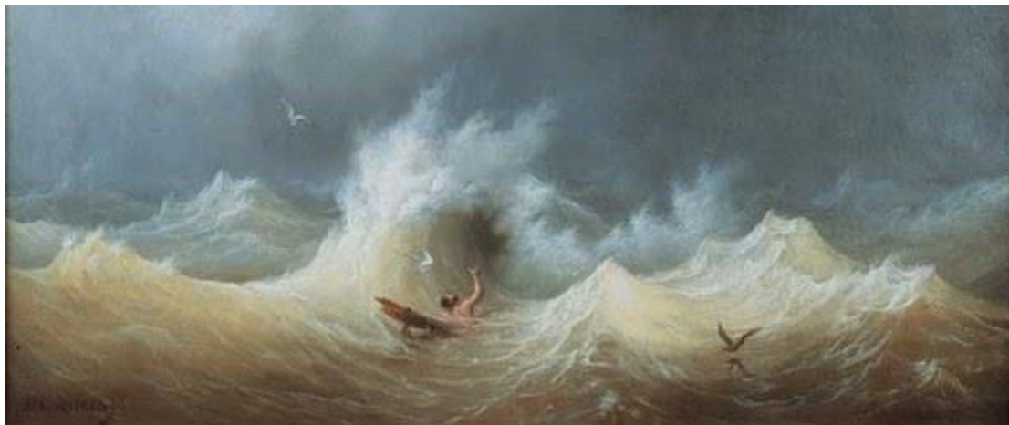
Le naufragé peinture de Louis Garneray

Qui dira les dangers auxquels est exposé pour une maigre rémunération le courageux pêcheur côtier ?