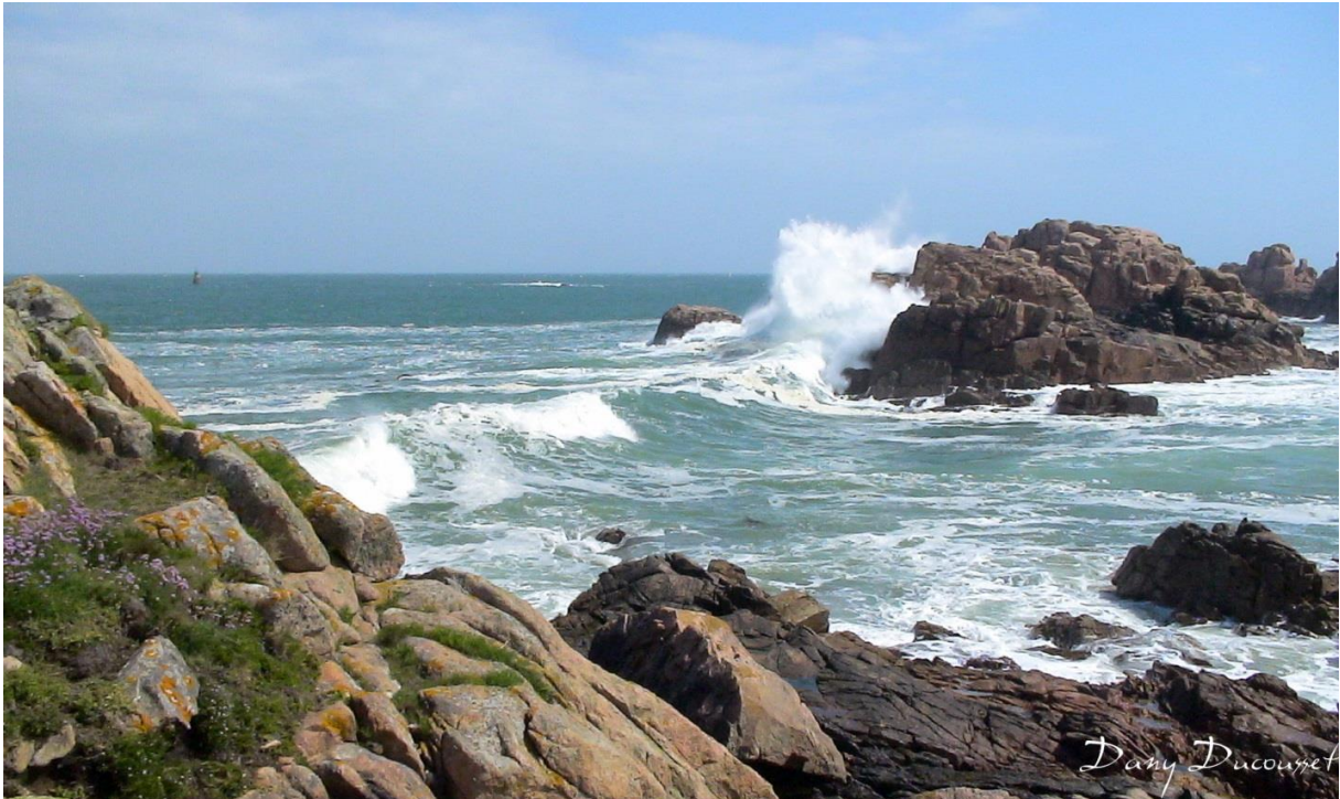
La côte de Bréhat est hérissée de rocher et la mer y est souvent dure