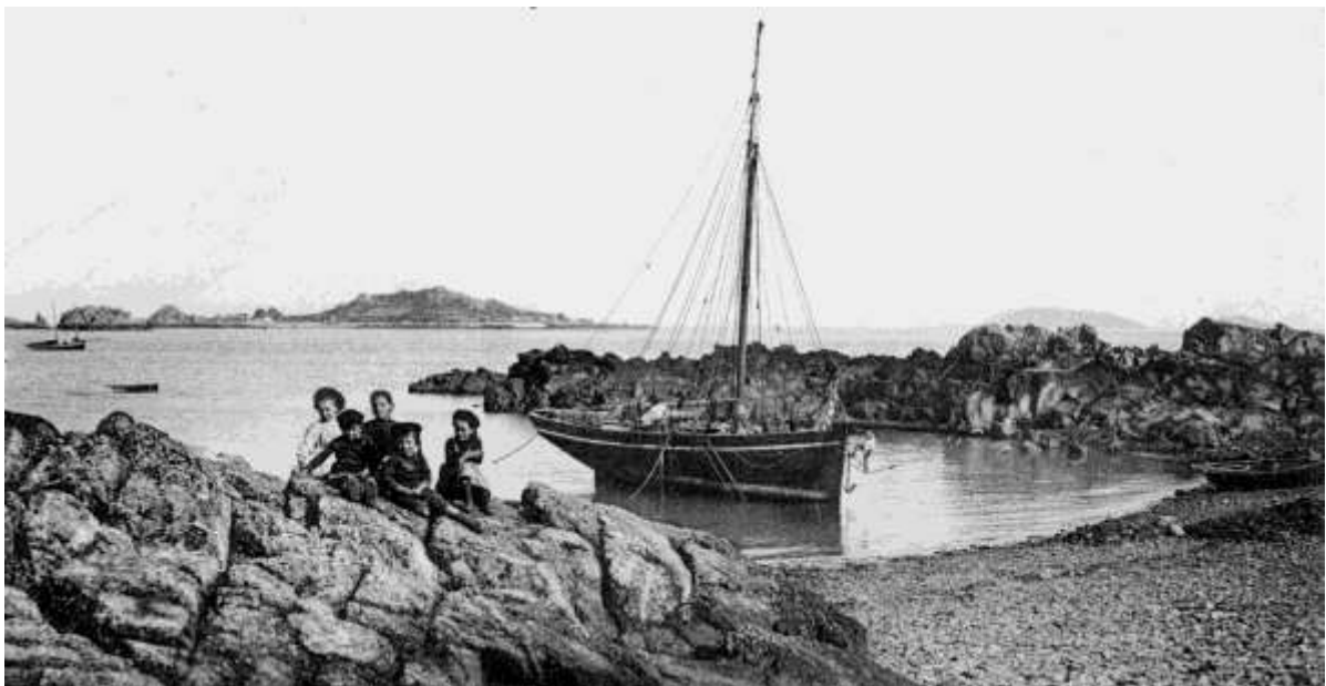
Enfants de Pors-Even vers 1905

Les garçons de cette photo sont nés vers 1885, à 20 ans vers 1905 ils sont inscrits maritimes et ont déjà une solide expérience de marin, Ils sont appelés pour 3 ans de service militaire dans la Marine Nationale. En 1914 à la déclaration de guerre ils sont mobilisés, la Marine a effectif trop nombreux et l'armée à besoins d'hommes dans les tranchés de Verdun ou de la Somme, ils y seront envoyés sur le front comme fusillés-marins ou réaffecté dans l'armée de terre, beaucoup ne reviendront pas au pays.