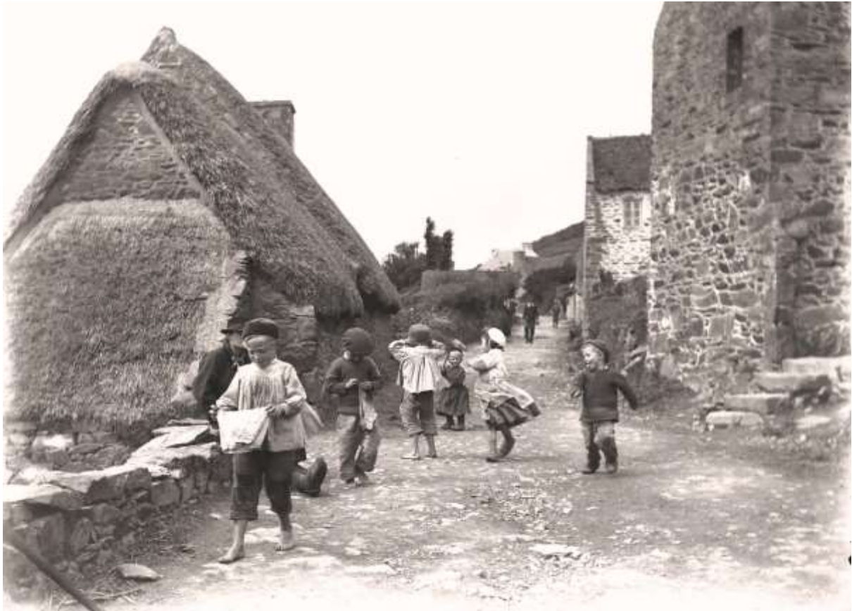
Pors Even 1891 Edmond Rudaux

Au tournant du XIXème et du XXème siècle les familles étaient nombreuses dans les communes littorales. Sur les photos anciennes on voit souvent les enfants poser sérieusement l'expression de leur visage est souvent dure, cette superbe photo de Pors Even commune de Ploubazlanec à la fin du XIXème se démarque, les enfants y sont bien vivants et joyeux.