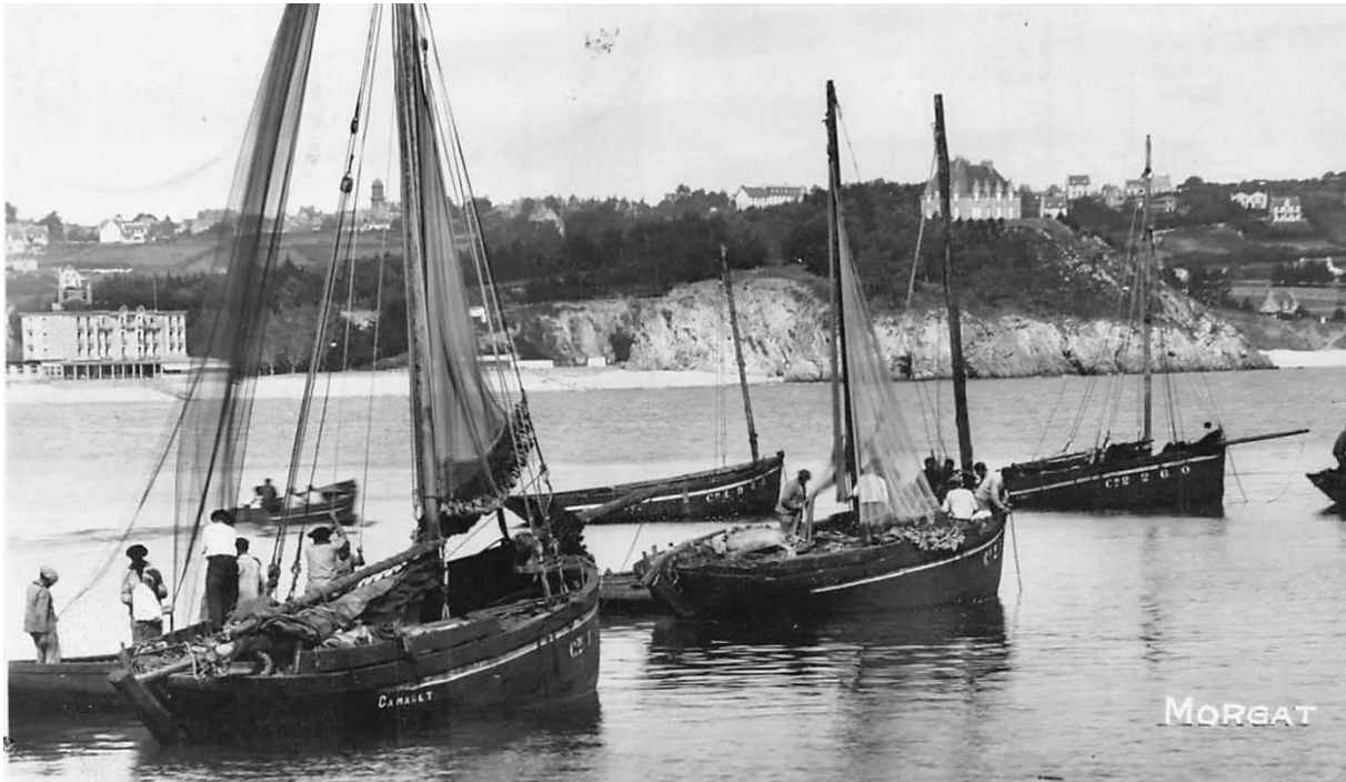
Morgat dans les années 30, deux grandes chaloupes sardinières pontées armées à la pêche aux sardines au filet droit avec leurs canots annexes. La première a été régréée en sloop la seconde est toujours grée en chaloupe.