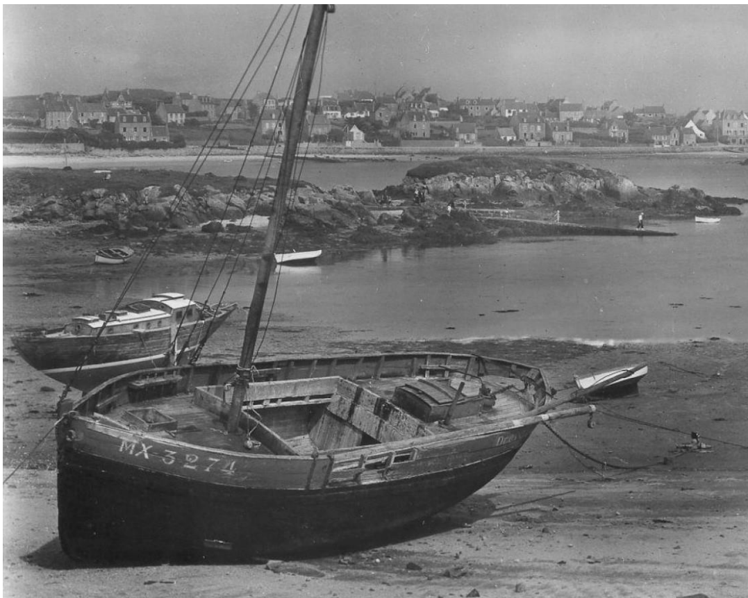
Les deux Jeanne désarmée à Pors an Eog, le vieux port de l'île de Batz.

"CAN" Immatriculation des bateaux par l'Inscription Maritime