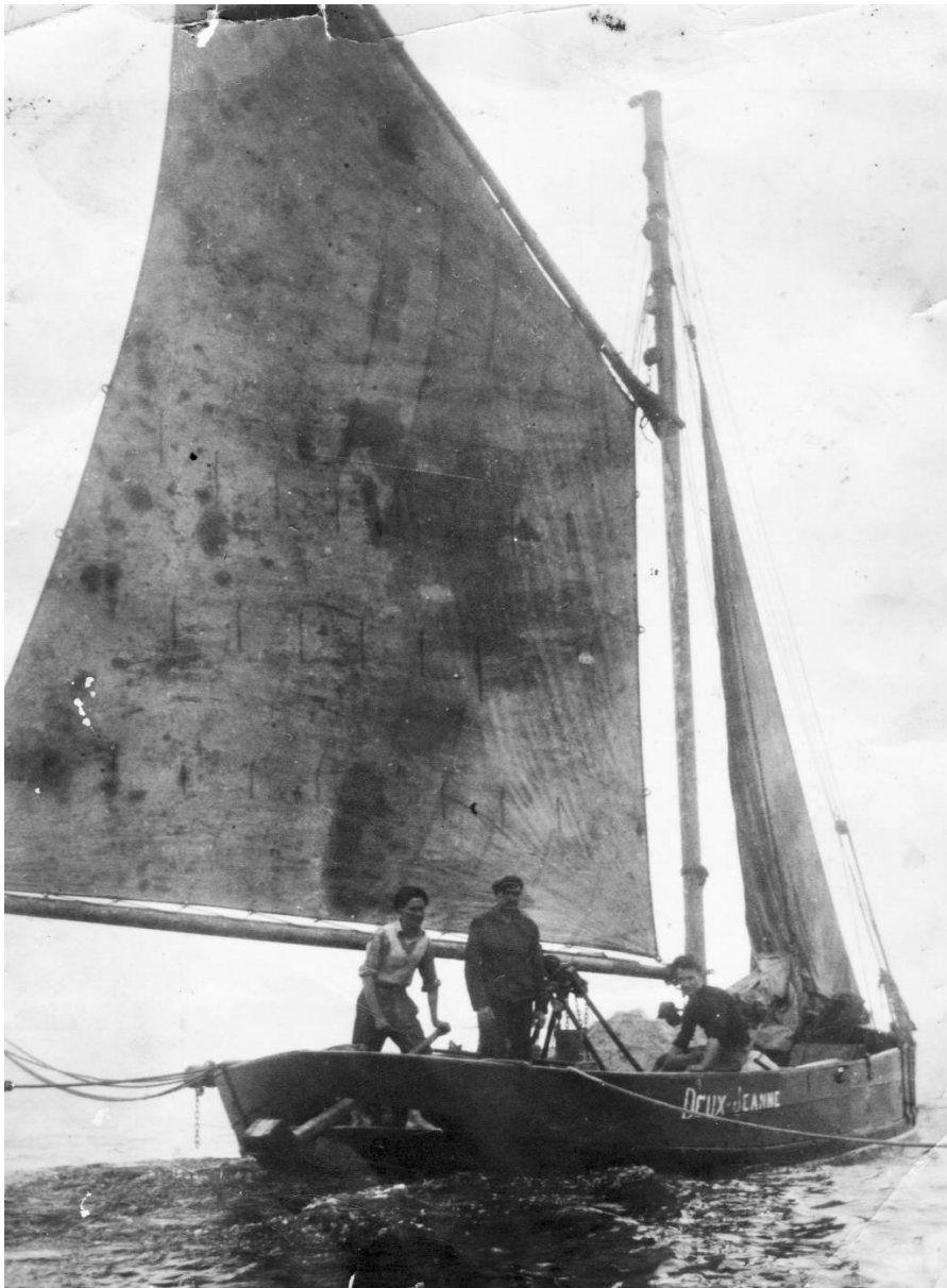
Retour à la voile des Deux Jeanne lourdement chargé de sable.

est muni d'une hiloire assez haut, un treuil a main est installé en avant du mat pour actionner la benne à sable. Le mat est il conservé le moteur est il changé nous ne le savons pas. Ce bateau va faire la « pêche » au sable de mer à la benne seulement pendant quelques années, sa capacité de charge est de 18 m3 soit plus de 30 tonnes ce qui est assez limité. Par la En 1951 Les deux Jeanne est désarmé et échoué au fond de Pors an Eog, il a certainement été rapidement démantelé pour en faire du bois de feu. A cette époque, les Cabioch de l'île de Batz vont acheter d'occasion d'ancienne gabare de Lampaul pour les armer au sable, ces grands sabliers comme le Nd du Folgoet avaient une capacité de charge nettement plus importante et le treuil de la benne était motorisé.